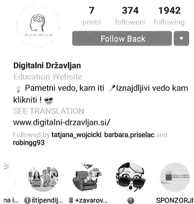
Slika 3: Instagram profil Digitalni Državljan