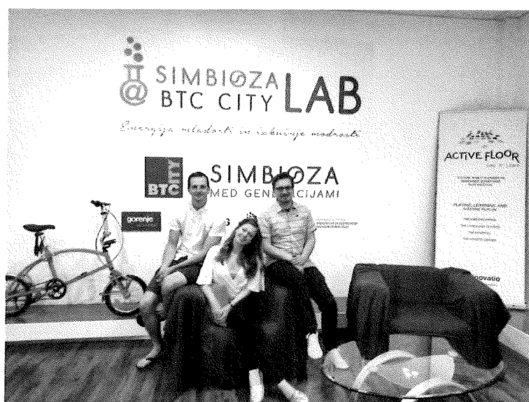
Slika 2: Učna ura namenjena starejšim v povezavi s partnerjem na projektu Simbioza Genesis, s.p.