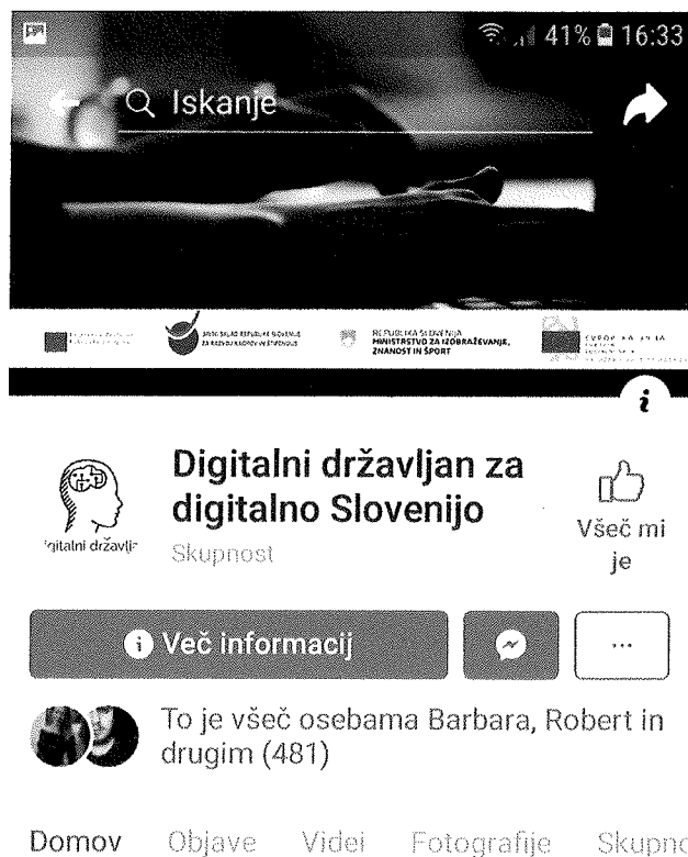
Slika 4: Facebook profil Digitalni državljani za digitalno Slovenijo