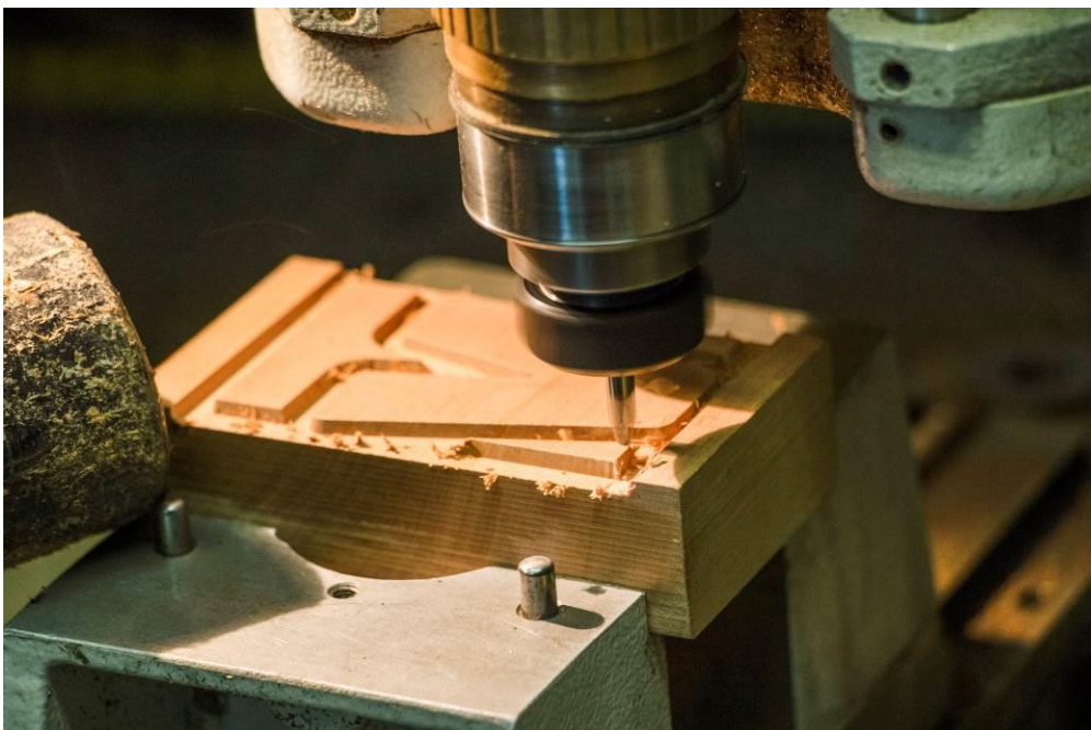
Izrezovanje lesenih črk