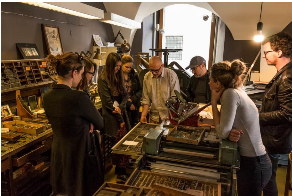
Zavod tipoRenesansa: pregled lesenih črk za visoki tisk