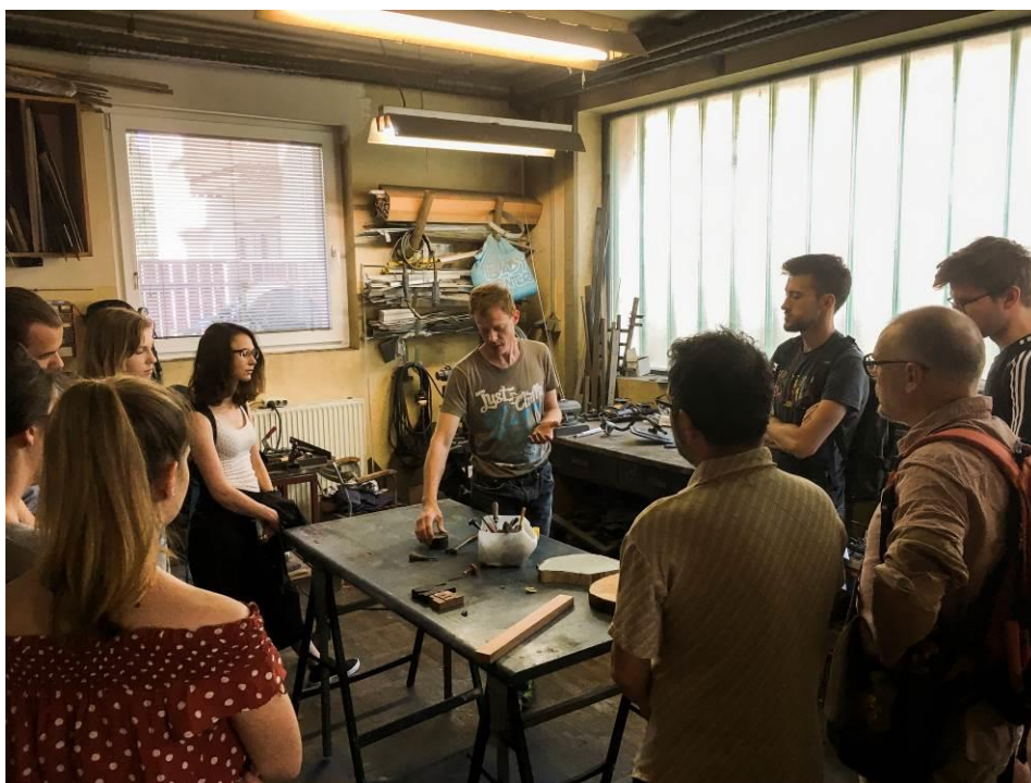
Delo v studio GIO