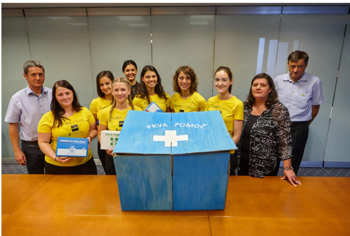
Avtor fotografije: Iztok Ameršek