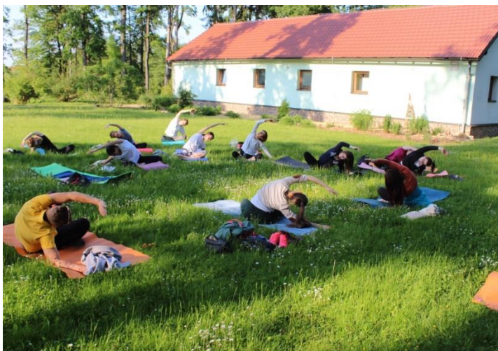
Joga v Botaničnem vrtu