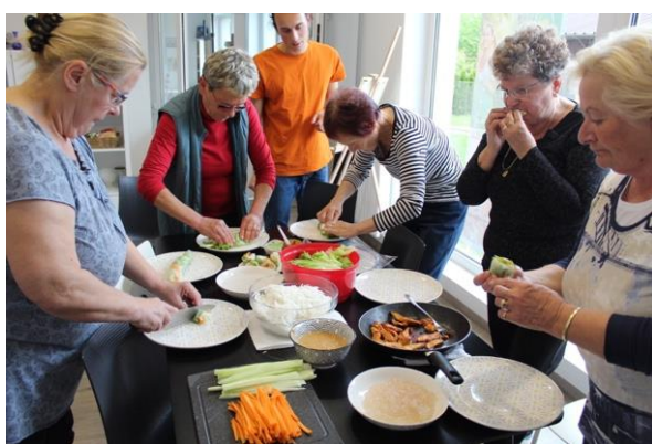
Delavnica vietnamske kuhinje